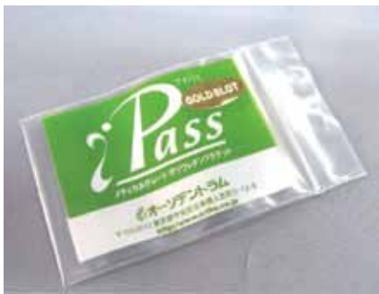
補充パック 10個入 / 1パック