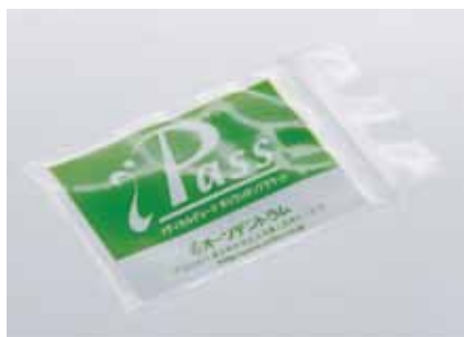
補充パック 10個入 / 1パック

歯面に対する適合性をより高めたベースコンタア。安定した接着と容易なディボンディングのためのメカニカルロック(ダブティル/PAT)採用。